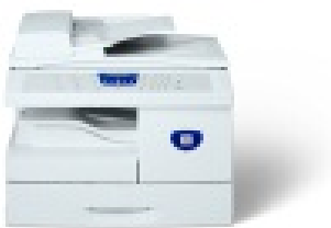
WorkCentre M15i con Alimentador automático de documentos

Xerox es sinónimo de calidad, innovación y servicio, y equivale a fiabilidad día a día. WorkCentre M15i es extremadamente duradero, y está diseñado y construido para funcionar impecablemente en las condiciones actuales de alta velocidad y enorme presión que imponen los grupos de trabajo.